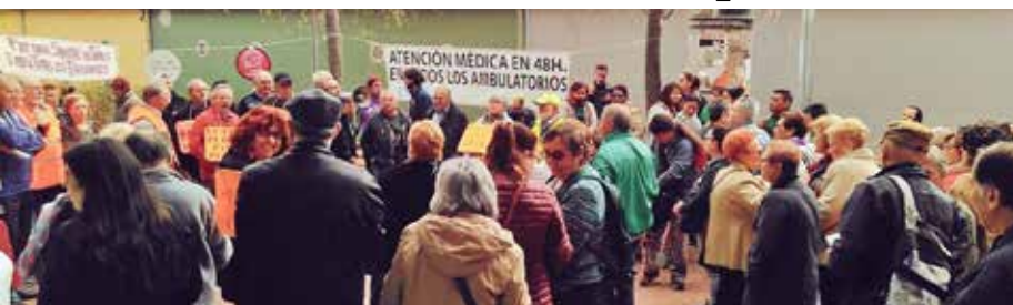
La Marea blanca reivindicant la sanitat pública de qualitat al CAP de Can Vidalet.

L'atenció als pacients s'està deteriorant a causa de les retallades en sanitat pública que realitza, des de fa anys, el govern de la Generalitat de Catalunya.