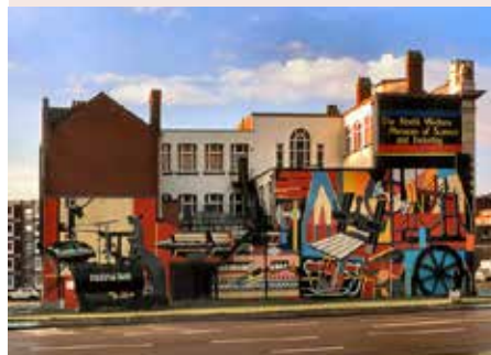
Manchester, passat fabril, futur cultural

Les inversions urbanístiques per portar-ho a terme han d'impactar directament als nostres barris, per apropar la gent a la cultura i perquè puguin participar del projecte de ciutat.