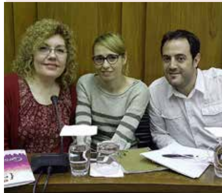
Les regidores i regidor de CanviemLH al Ple.

Al passat ple extraordinari de debat de l'estat de la ciutat, CanviemLH vam deixar clar que som l'alternativa al govern del PSC, ja que impulsem un model de ciutat que garanteix els drets fonamentals dels nostres veïns i veïnes.