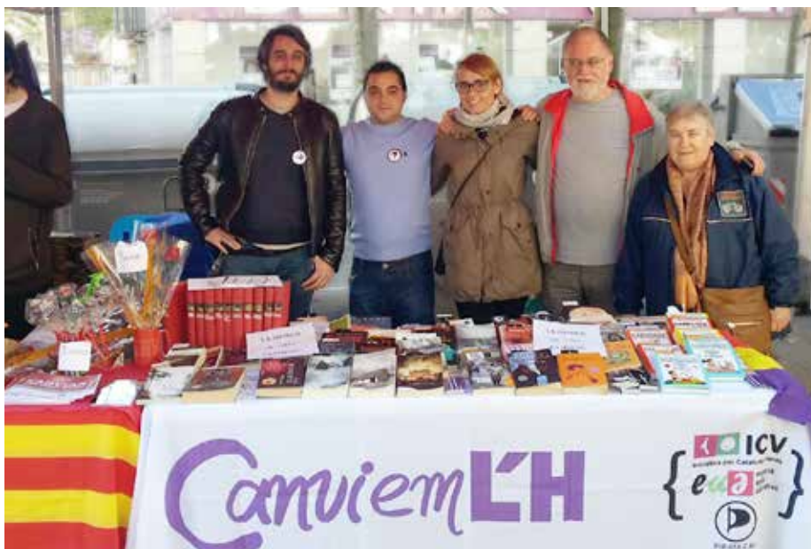
Part de l'equip de CanviemLH a la carpa de Sant Jordi del passat 2016. Apostem per la cultura!