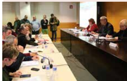
Plenari del Consell Comarcal del Barcelonès.

La creació de l'AMB li va treure la raó de ser. Deutes milionaris d'empreses públiques, càrrecs a dit, descontrol financer, informes de la Sindicatura de Comptes... un desgavell que tornarà a pagar la ciutadania.