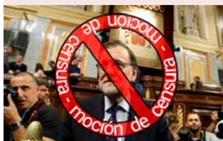
La moció de censura, eina contra la corrupció.

Per que cal recuperar la confiança de la ciutadania en les institucions i en els seus representants, els principis d'honestat, respecte i la bona administració dels recursos públics Prou saqueig! Prou corrupció!