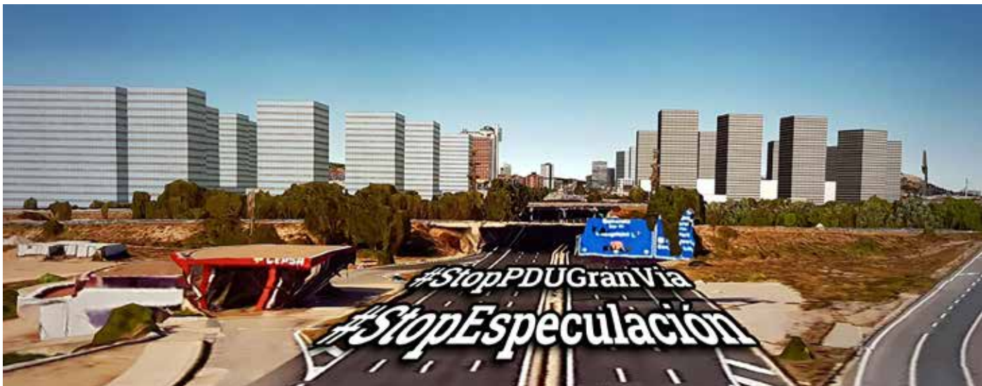
Reconstrucció 3D del PDU de la Gran via. Especulació, ciment, formigó, quitrà i fums de cotxes que vol implantar el PSC a l'última zona agrícola.