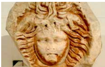
El cap de la medusa romà de L'Hospitalet.