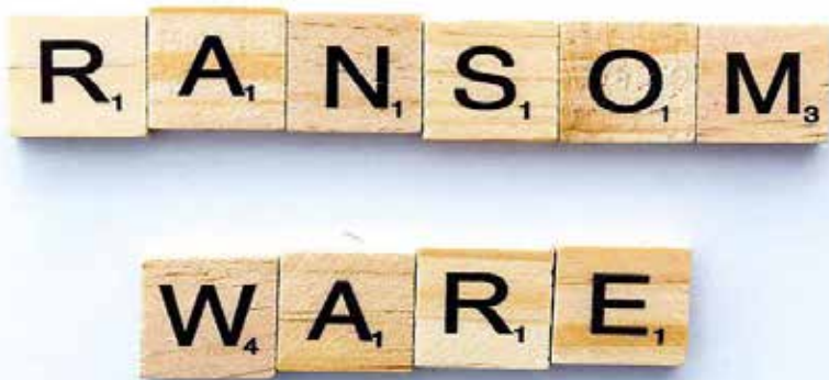
Els delinqüents fan servir el ransomware per bloquejar els ordinadors i demanar rescats.

L'externalització i creure que contractant un hacker estrella, els virus no entraran, ja no és caure a l'infantilisme sinó a la pitjor irresponsabilitat.