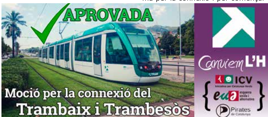
Moció de CanviemLH aprovada per tots els grups excepte PP i CiU al ple de l'Ajuntament de LH

CanviemLH apel·lem a la responsabilitat política perquè aquesta infraestructura es comenci a fer realitat durant aquest mateix any i tenir la connexió com més aviat millor.