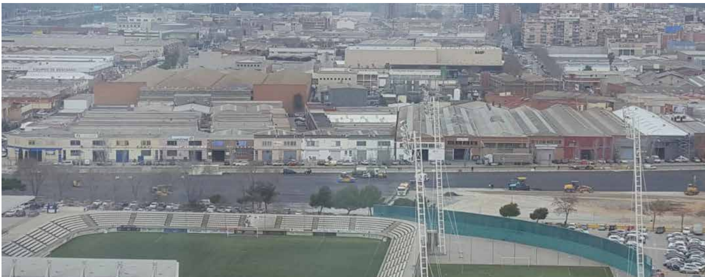
Operaris asfaltant el solar destinat a l'instal·lació puntual del Cirque du soleil que ha costat més de 1.200.000 € de diners públics.