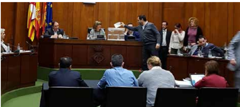
Votació en urna de la síndica de Greuges al ple municipal al ple municipal de gener de 2018.