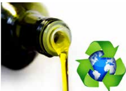
El reciclatge de l'oli és indispensable.

L'oli és un residu reciclable i el d'ús domèstic representa el 88% de l'oli que es podria arribar a reciclar.