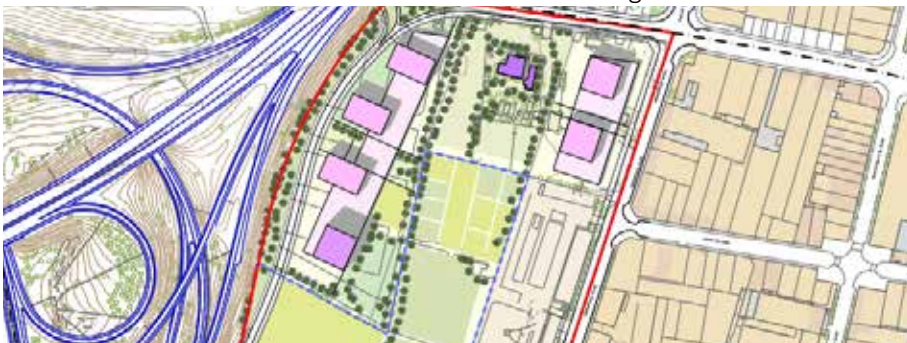
Ordenació indicativa del PDU al sector 3 (deixalleria). 6 gratacels en una zona industrial buida.

El PSC fomenta la participació decorativa que només afecta aspectes trivials i a 25 hectàrees de les 100 afectades. Mai han volgut ni ara volen debatre sobre el planejament.