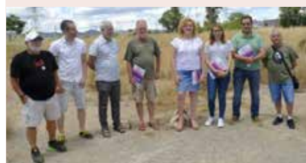
El pla especulatiu de Gran Via a judici.

Demanem la retirada global de tot el procediment. Farem el possible perquè aquest atemptat contra l'urbanisme, la salut de la ciutadania i la salvaguarda de l'espai natural, no es desenvolupi en la seva forma actual.