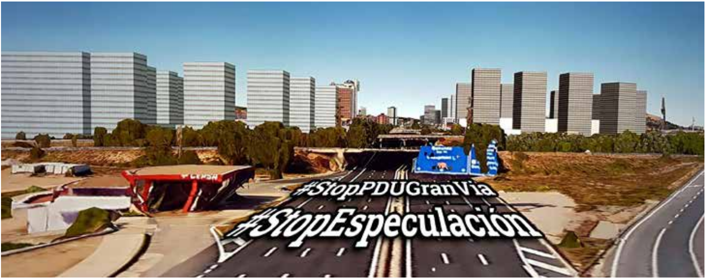
Reconstrucció 3D del PDU de la Gran via. Especulació, ciment, formigó, quitrà i fums de cotxes que vol implantar el PSC a l'última zona agrícola.

A cop de titulars manipulats el PSC, amb el suport de l'antiga Convergència, intenta vendre un projecte especulatiu i de bombolla immobiliària com si fos de regeneració urbana i pel bé comú.