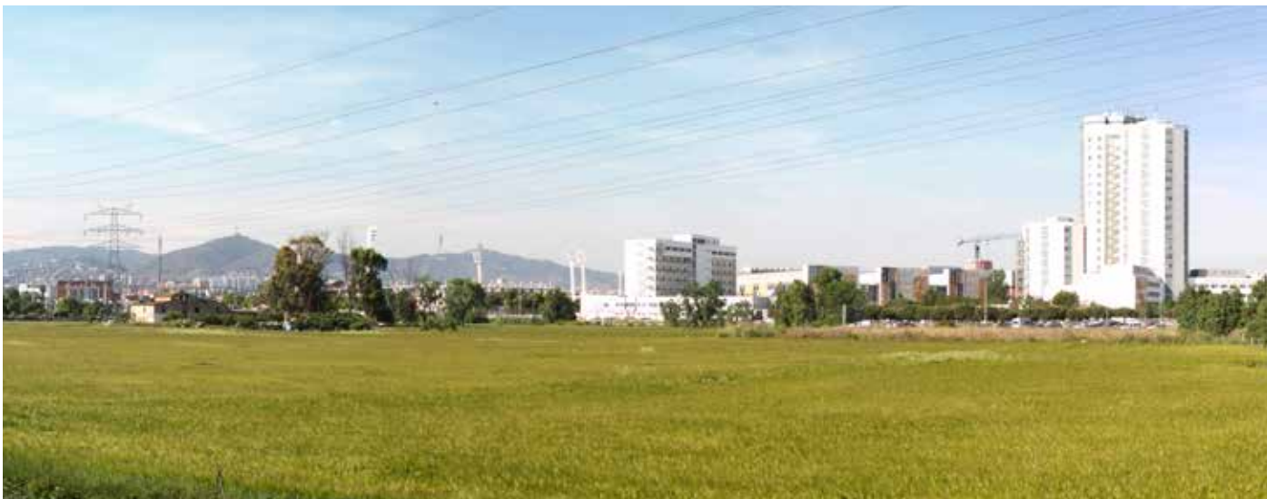
Cal Trabal actualment ja és una zona natural i agrícola rica en diversitat. Necessitem fer accions públiques per cuidar i fer estimar la zona.

Cal Trabal és actualment una zona marginada i maltractada per l'urbanisme i necessita intervenció per donar-li qualitat ambiental: Consolidació de la zona agrícola i incorporació al parc agrari, soterrament de línies elèctriques, talussos vegetals que facin d'amortiment de les vies ràpides, trasllat i/o soterrament de l'estació elèctrica, obertura i condicionament de camins al públic, il·luminació, restauració i potenciació de les masies com a equipaments, permeabilitat de la zona amb la ciutat existents, la millora de l'accessibilitat als dos hospitals, el soterrament total de la Gran Via (amb una solució de soterrament total i abastant els 2 km sencers que queden), el soterrament de les vies