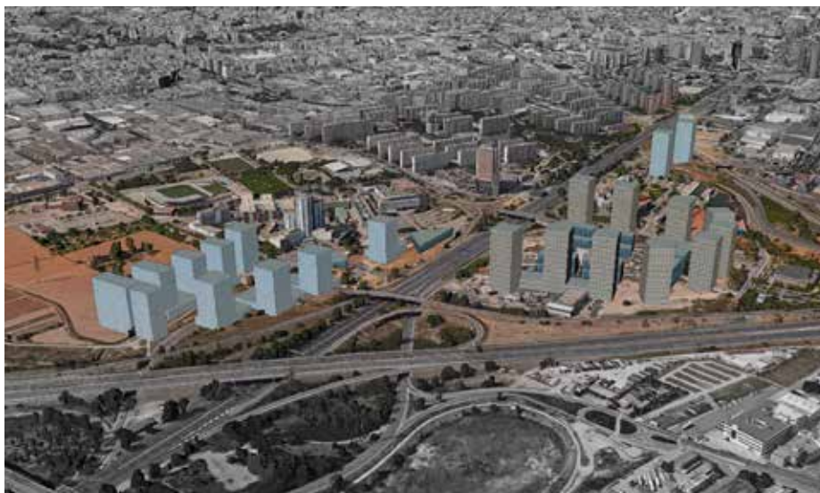
Vista aèria de conjunt de la 1a aprovació inicial del PDU. 26 gratacels a zones verdes.